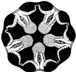
Skiven af Ophionephtys limicola .

Ophionephtys limicola m. danner imidlertid, som den vedføjede Skizze antyder, paa en ny og uventet Maade en Overgang mellem de nøgne og skælkledte Amphiurider. En Deel af Skiven er nemlig aldeles nøgen, en anden Deel — foruden Radialskjoldene og de andre i Klasse med dem staaende Dannelser — derimod beklædt med vel udviklede, haarde og faste Kalkskæl! Havde disse udbredt sig over hele Skiven, vilde Dyret være at henhøre til Slægten Amphiura ; havde de derimod manglet ganske, vilde det sluttet sig nærmest til Ophiopeltis og til den nedenfor beskrevne Ophionema blandt de aldeles nøgne, blødhudede Slangestjerner. Som yderligere Vidnesbyrd om Umuligheden af at undersøge disse som en egen Gruppe eller Familie har derfor denne nye Slægt en egen Interesse, den er et nyt Led i den lange Kjæde af Former, som forbinder de Slægter, der frembyde den største Modsætning i ydre Charakterer, ved næsten umærkelige Overgange og gjør en systematisk Opstilling af Ophiuriderne til en meget indviklet og vanskelig Sag.