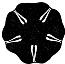
Skiven af Ophionema intricata .

Ophionema intricata m. I det Virvar af løse Skiver og skiveløse, men tildeels endnu sammenhængende Arme samt Armbrudstykker af den nys beskrevne Form, som tilligemed talrige Exemplarer af Amphipholis gracillima udgjorde Indholdet af et af Hr. Riise indsendt Glas med Udbyttet af den ovenfor omtalte Fangst paa 12 Fods Dybde i St. Thomas's Havn, fandtes endnu to løse Skiver af en anden ubeskreven Amphiuiride, der aabenbart maatte være nær beslægtet, dels med den nys beskrevne Ophionephthys , dels med Ophiopeltis .